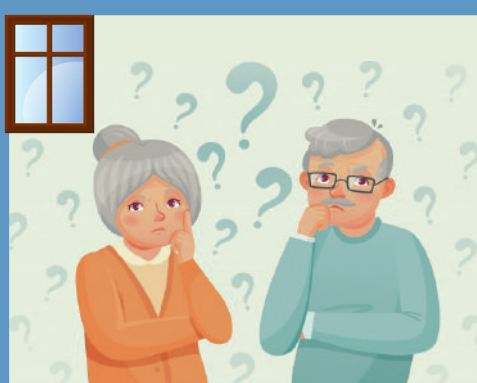
« Notre logement est dangereux et pas adapté. Comment faire ? »