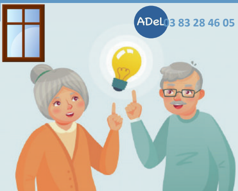
« Je sais ! J'appelle Ville et Services et demande le projet ADEL ! »