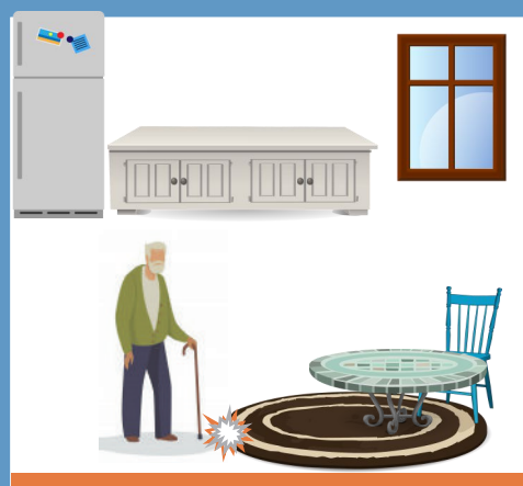
« Ce tapis me gêne pour me déplacer... »

Des aides techniques conseillées mais jamais installées.